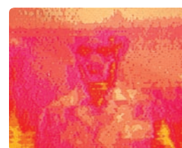
Deze infrarood foto illustreert de moeilijkheid die een warme zomertemperatuur presenteert aan PIR detectoren